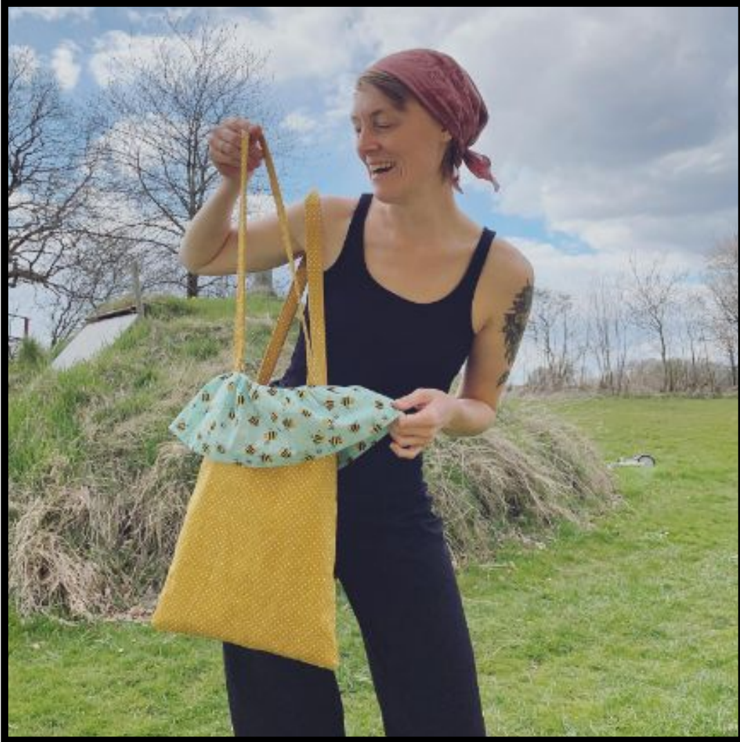
Design par : Rain in May (Maj Leszczynski Suurballe) @rainin_may